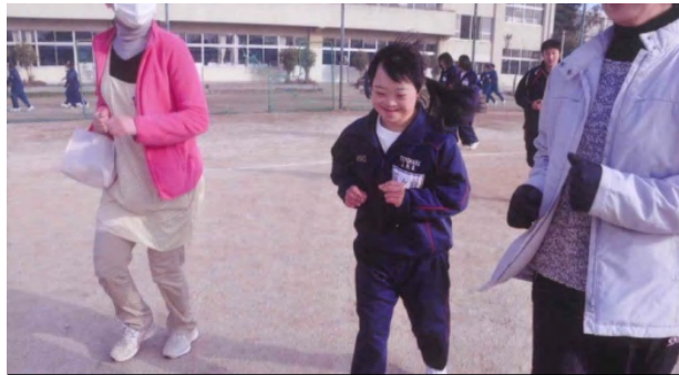
子どもの成長はうれしい… 筆者のお子さんのマラソン風景

そのお母さんのお話を聞いて思ったことがあります。それはお子さんのことを「～は得意なんです。」「私の言っていることはわかっているみたいです。」と話すとき、とても力強く話していたことです。子どもに障害があると、ほんの少しの成長や小さな発見が親にとっては本当にうれしいことなんです。まして、それを誰かに話せるというのはさらにうれしいのです。しかも、うれしいだけでなく、前向きになれる、心が強くなれることなのだと思います。そういう意味でもTOKOのおしゃべり会を大切にしていきたいと改めて思いました。